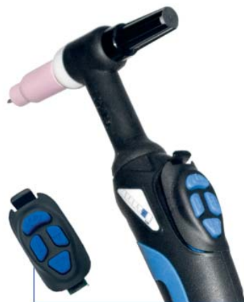
Szybkowymienny mikrowyłącznik SPARTUS® Easy 4B ze zdalnym sterowaniem UP & DOWN